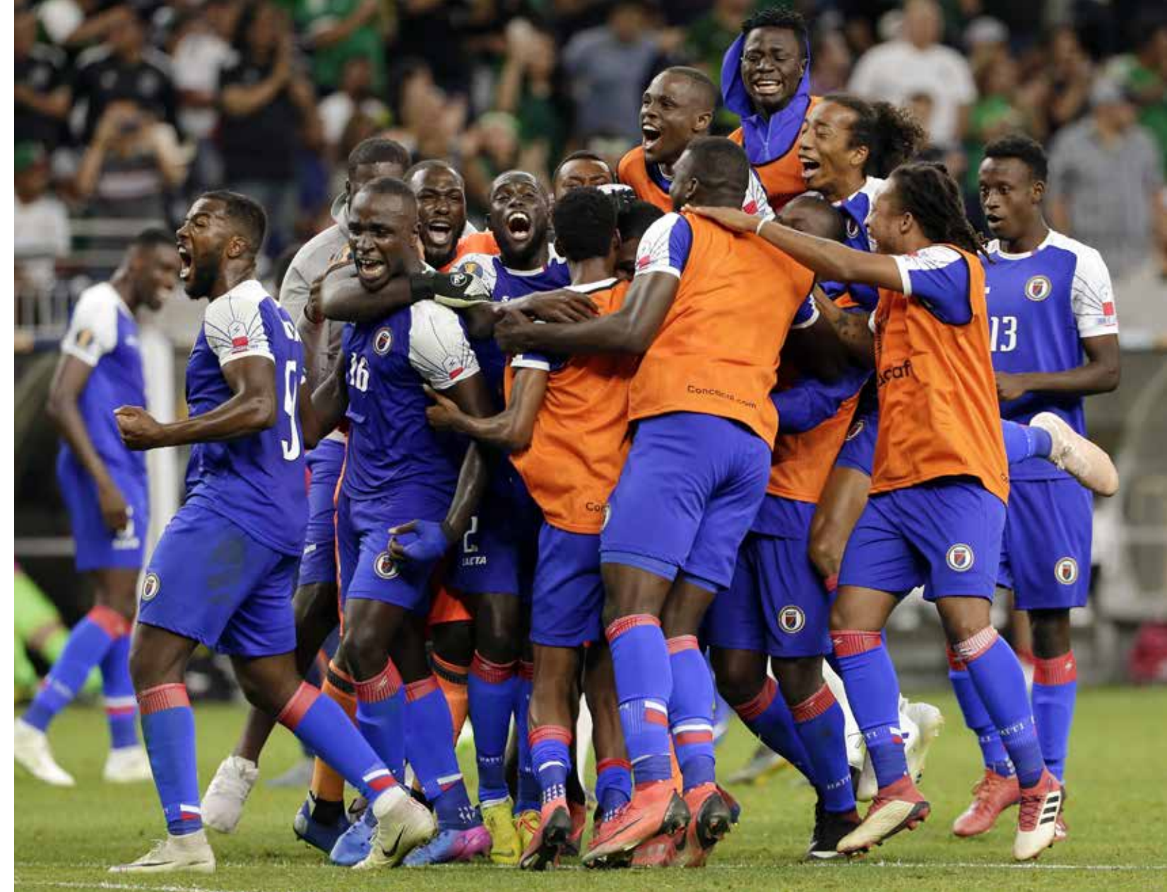
Photo de la victoire de la sélection haïtienne de football contre l'équipe du Canada à la Gold Cup en 2021.

“ Tout seul, on va plus vite, Ensemble, on va plus loin. Proverbe Africain ”